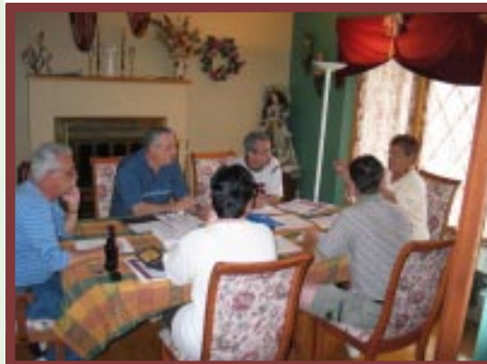
Réunion du 15 mai 2004

Les membres du comité organisateur s'étaient fixé tout un ordre du jour lors de la première rencontre tenue le 15 mai 2004. Les sujets ont suscité de nombreuses discussions et portaient sur les finances, la sécurité, l'hygiène, l'animation, le déroulement des activités et la gastronomie. Les préparatifs allaient bon train et des réunions ont été mises au calendrier jusqu'au 25 juillet, soit une semaine avant la tenue de l'événement. Chaque réunion est d'une durée approximative de trois heures et l'événement de cette année a nécessité sept (7) rencontres.